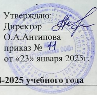
График проведения оценочных процедур в МБОУ «Русановская ООШ» на 2 полугодие 2024-2025 учебного года